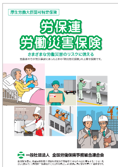
労保連労働災害保険リーフレット